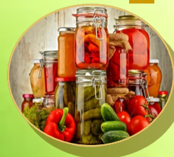
PRESERVACIÓN DE ALIMENTOS