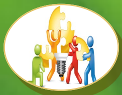
DESARROLLO DE NUEVOS PRODUCTOS