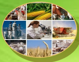
SUBPRODUCTOS DE PROCESOS AGROINDUSTRIALES Y PRODUCTOS DE MAR